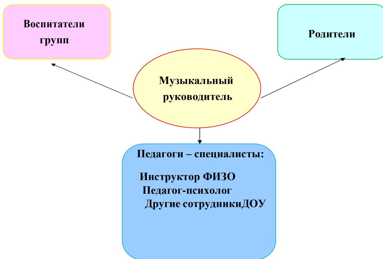
Схема организации работы со специалистами образовательного процесса