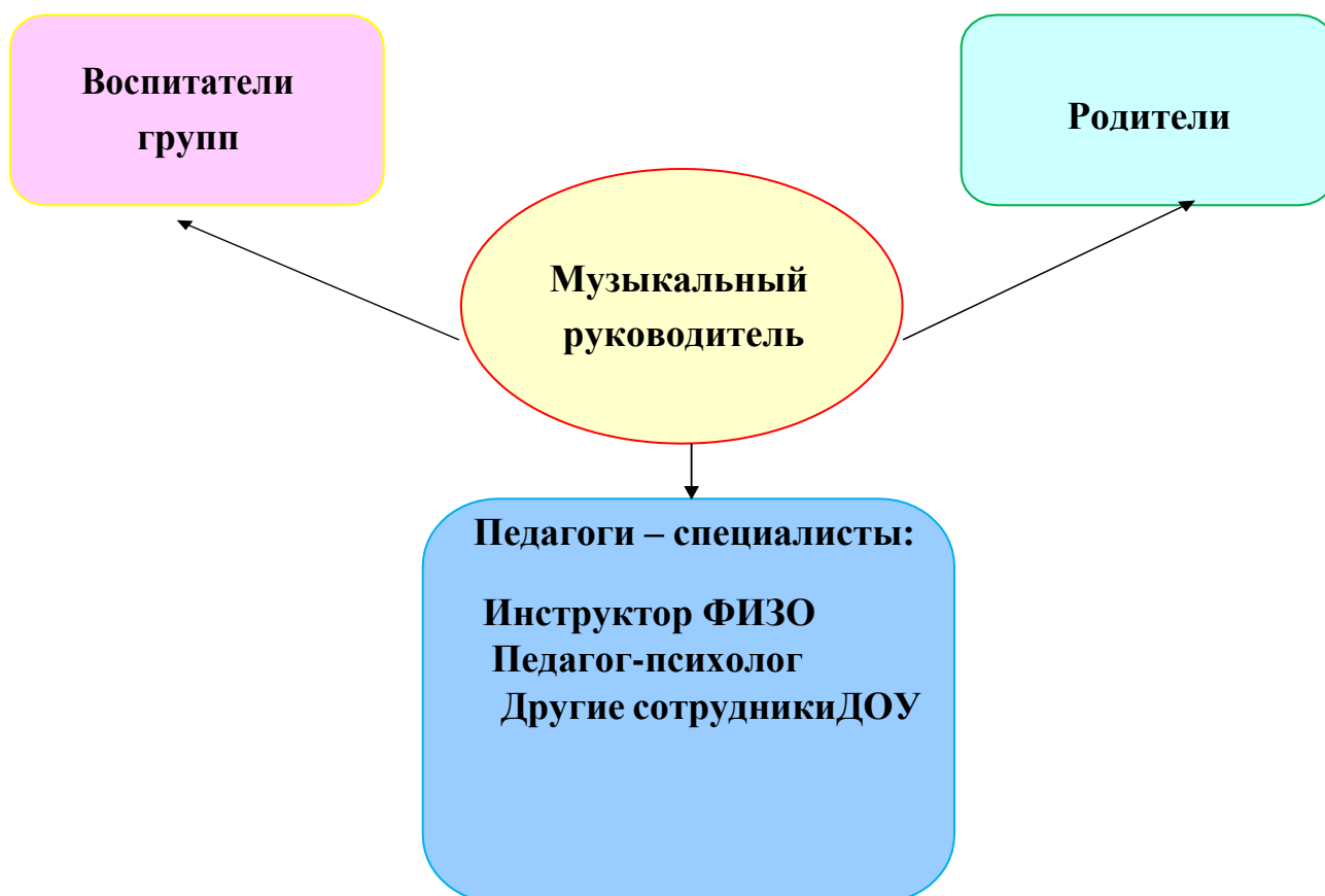
Схема организации работы со специалистами образовательного процесса